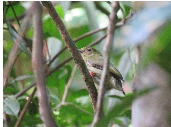
Manakin tijé sur site

La parcelle est constituée d'une forêt drainée sur pente au sous- bois lianescent en bon état de conservation.